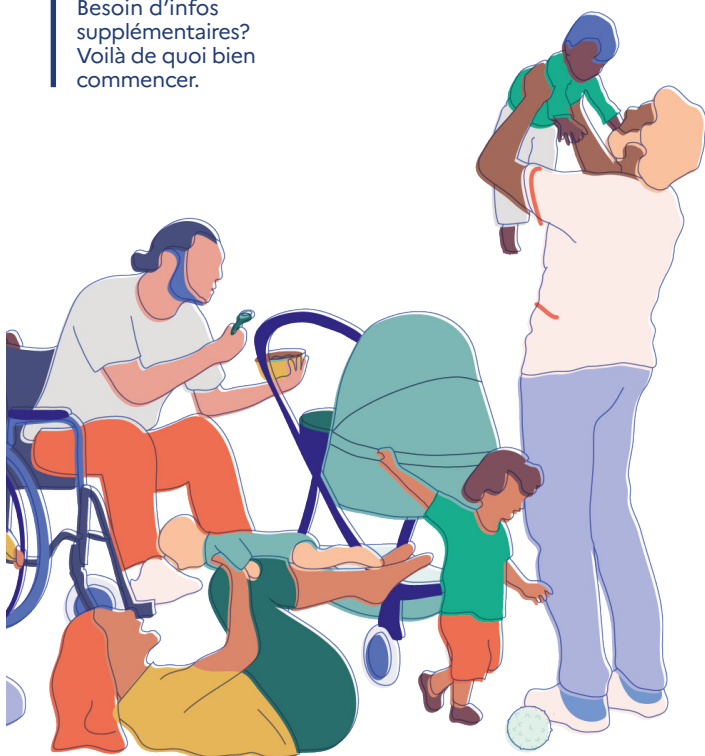
Les premiers mois

Besoin d'infos supplémentaires? Voilà de quoi bien commencer.